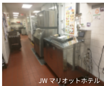
JW マリオットホテル