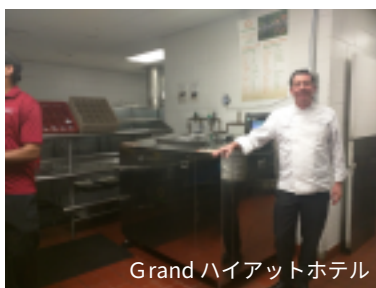
Grand ハイアットホテル